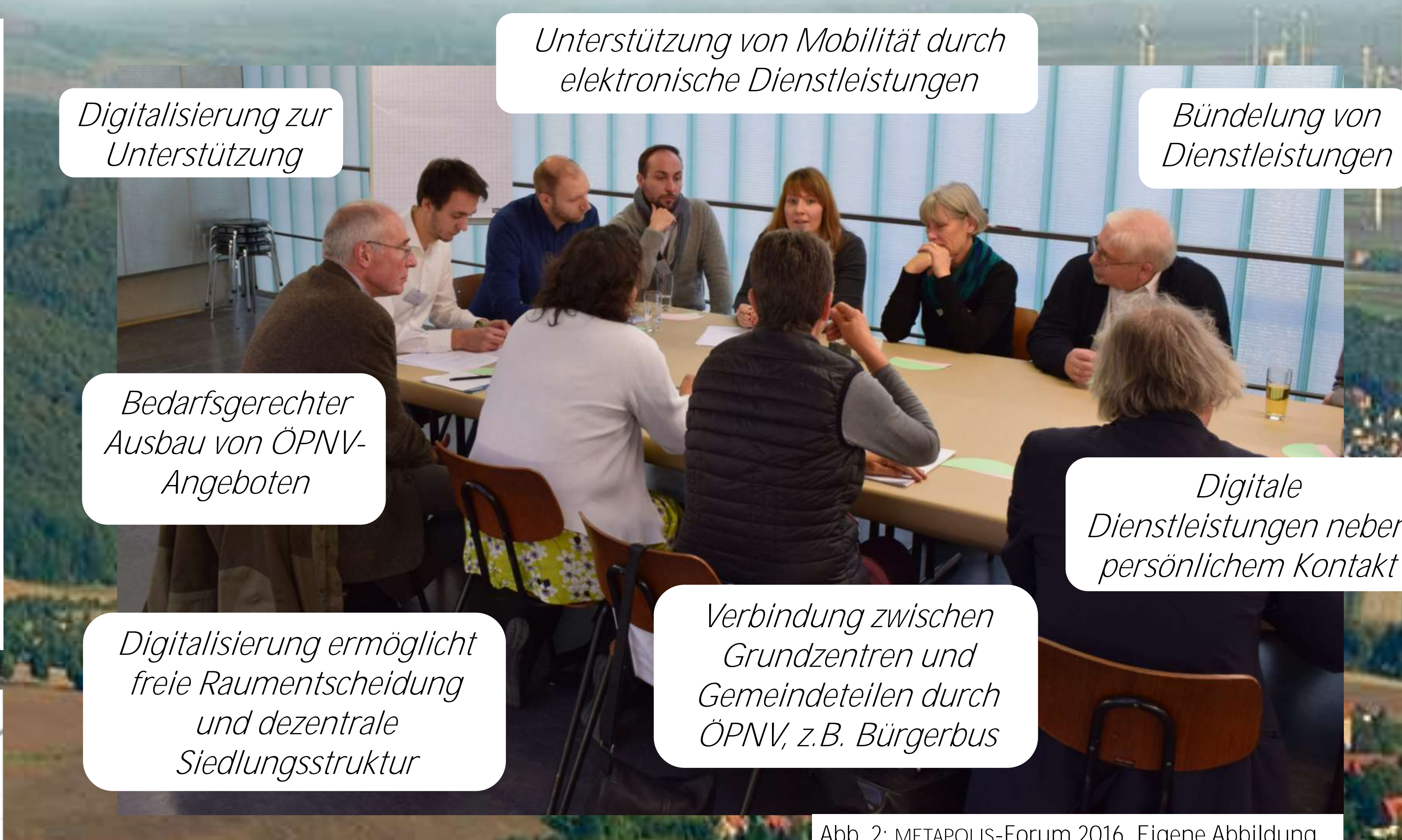
Abb. 2: METAPOLIS-Forum 2016. Eigene Abbildung.